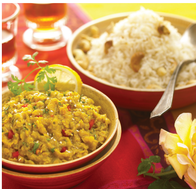
Suggestion de présentation du curry de lentilles à l'indienne.