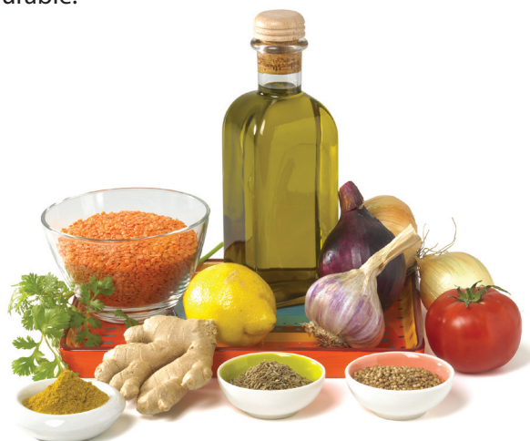
Ingrédients pour un curry de lentilles à l'indienne.

Beaucoup plus qu'un livre de recettes, ce manuel constitue ainsi une invitation à créer sa propre cuisine, alternative et gourmande, pour un monde durable.