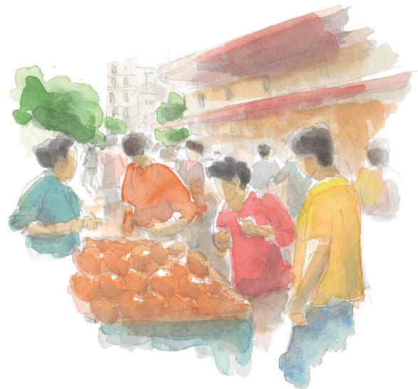
Avec les illustrations de Clément Luzeau.

- la qualité globale des produits alimentaires , plus frais, plus proches des saisons, plus complets ou intègres, issus d'agricultures éco-responsables et d'échanges équitables, sans oublier leur qualité sanitaire ;